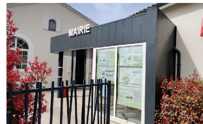
Exposition à la mairie de Sainte-Gemme