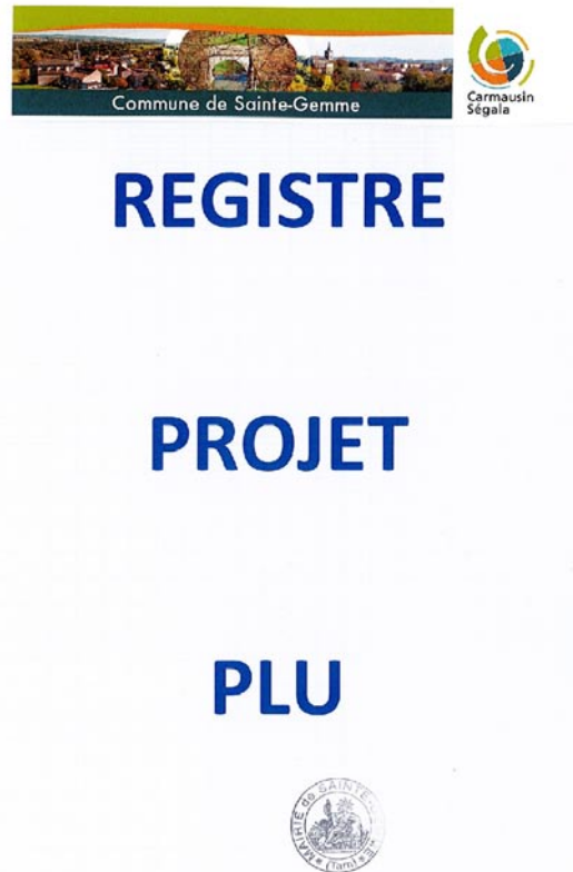
Affiche invitant la population à s'exprimer sur le projet de PLU

La commune de Sainte-Gemme a notifié n'avoir eu aucunes observations ou requêtes écrites.